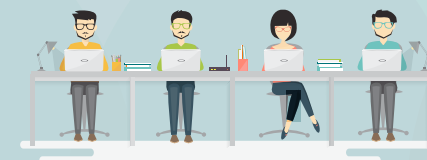
MEDEWERKERS DOEN GRATIS MEE